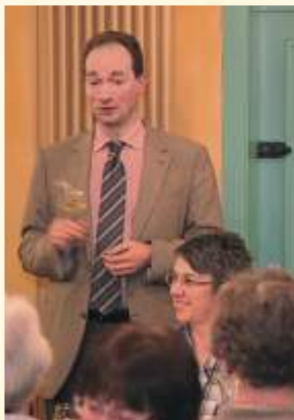
Weinseminar in der Oberen Karspüle: "Wissen vermehrt den Genuss"